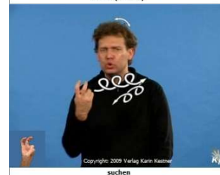
suchen