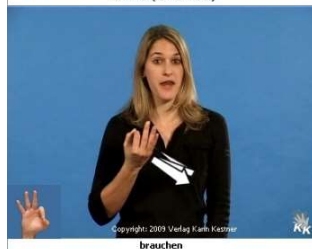
Copyright: 2009 Verlag Karin Kestner brauchen