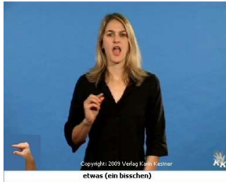
etwas (ein bisschen)