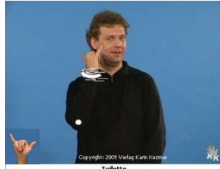
Toilette