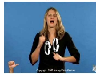
Copyright: 2009 Verlag Karin Kestner schmerzen (wehtun)