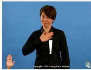
Mir geht's gut, regional