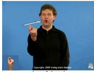
Copyright: 2009 Verlag Karin Kestner kommen (herkommen)