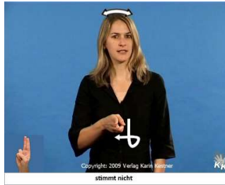
stimmt nicht