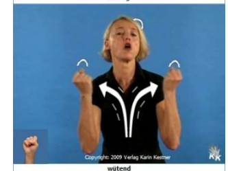
wütend