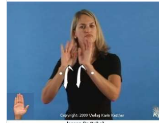
lassen (in Ruhe)